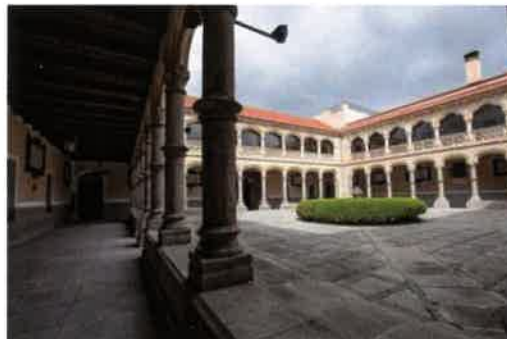
Patio de Orden: Claustro de estilo gótico-plateresco.

Salón de Actos: Construido en 1944. A ambos lados de la mesa presidencial dos grandes placas de mármol muestran a los artilleros que han alcanzado la Laureada de San Fernando.