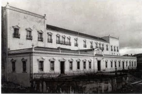
Fachada principal de la Academia de Artillería (1897)

La visita a la Academia de Artillería consiste en un recorrido guiado a lo largo del cual el visitante tendrá ocasión de contemplar la denominada Zona Noble de la Academia y las diferentes salas temáticas que albergan la colección museística.