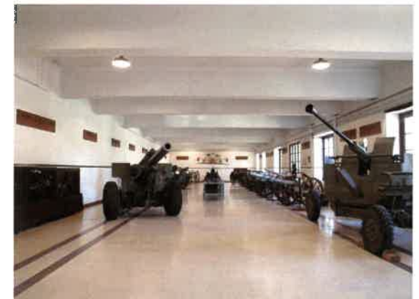
Sala de Materiales

Destaca su colección de minerales, rocas y fósiles