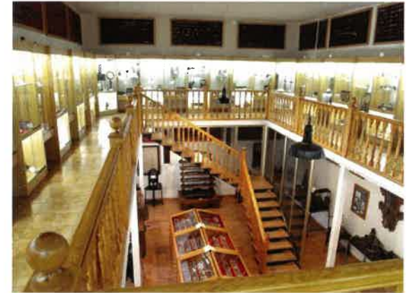
Sala de Ciencias y Tecnología

Destaca su colección de minerales, rocas y fósiles