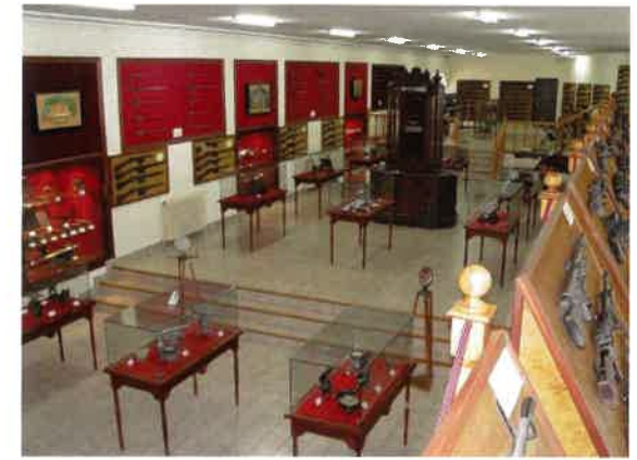
Sala de Armas Portátiles